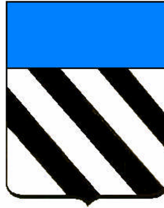
du Bois-Lanfray « d'argent à 3 bandes de sable, au chef d'azur »