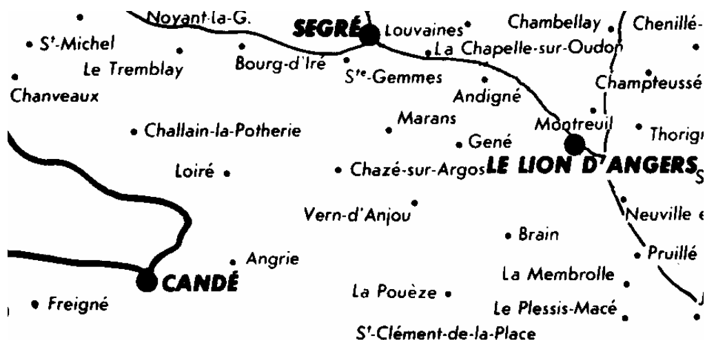
Extrait de la carte des anciennes paroisses de l'Anjou (en gras la frontière Anjou-Bretagne, en fin les rivières)