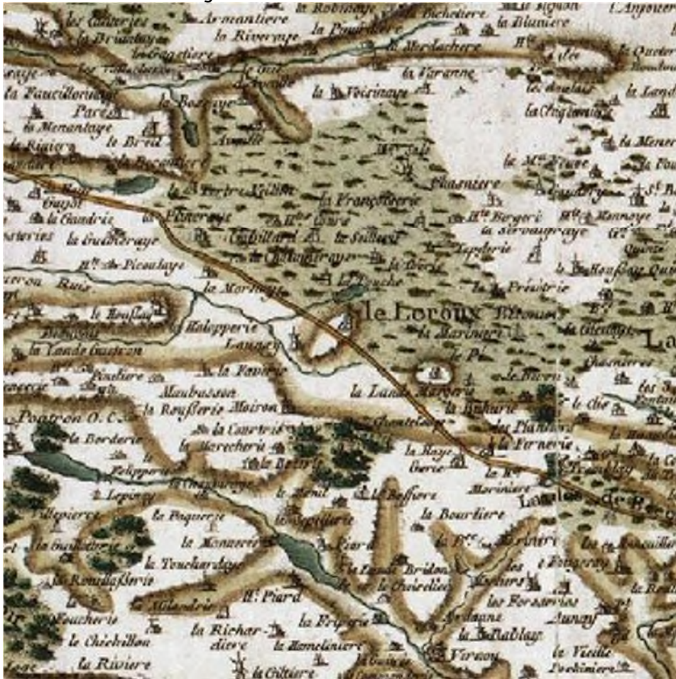
la forêt du Louroux-Béconnais, carte de Cassini