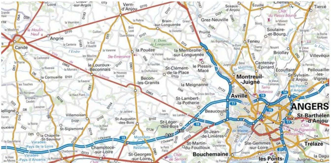
Le Louroux-Béconnais entre Candé et Angers (carte IGN)

L'origine des Brisebois du Maine-et-Loire se situe manifestement au Louroux Béconnais comme mon étude tend à démontrer.