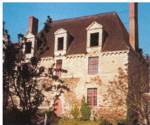
restes de l'abbaye de Nyoiseau (1997)