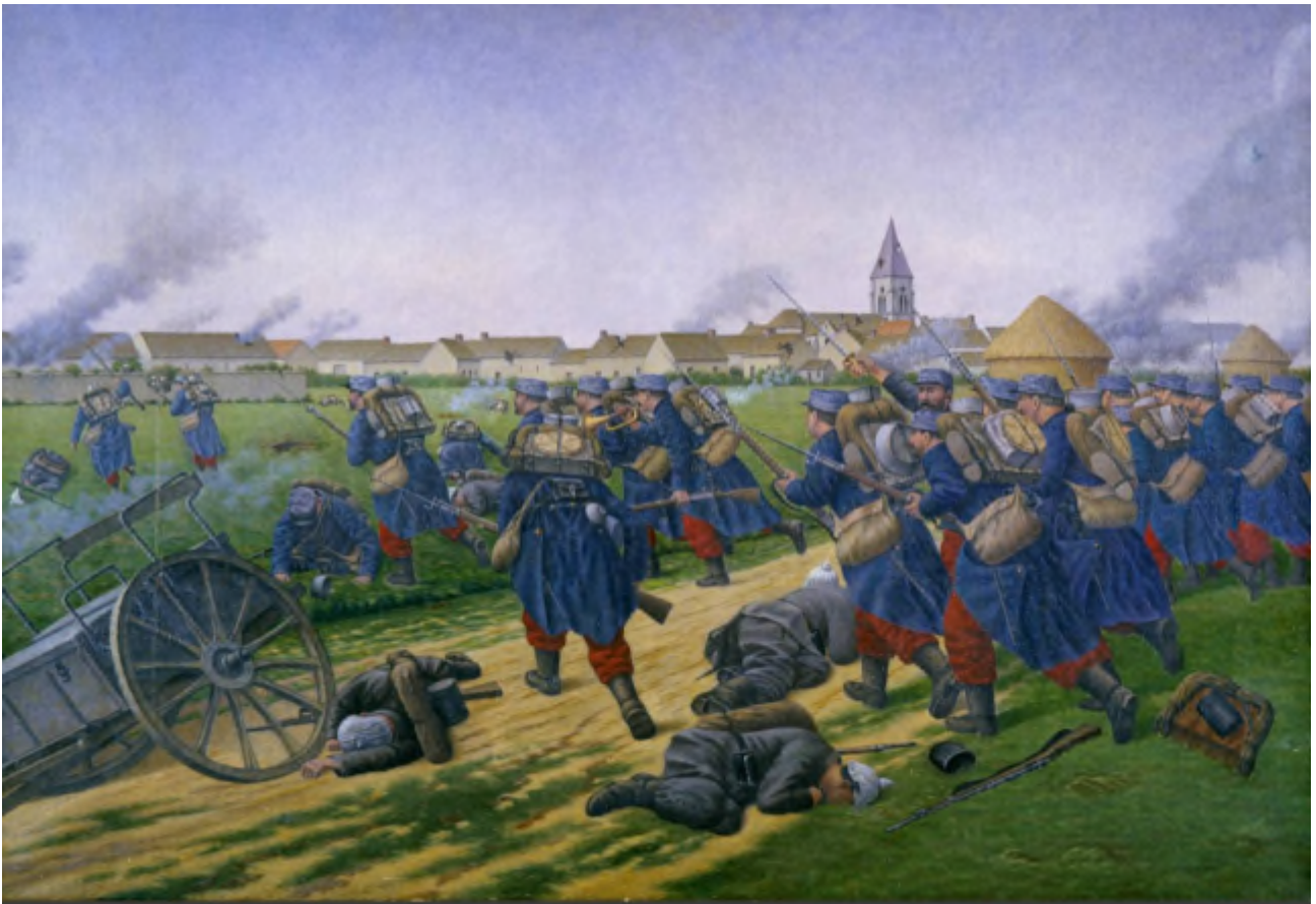
Bataille de la Marne 23 septembre 1914 : le pantalon garance, au début de la Première Guerre mondiale, exposait les militaires aux tirs des soldats allemands, équipés de tenues de couleur neutre (feldgrau). La tenue fut remplacée ensuite par le bleu horizon, moins voyant.