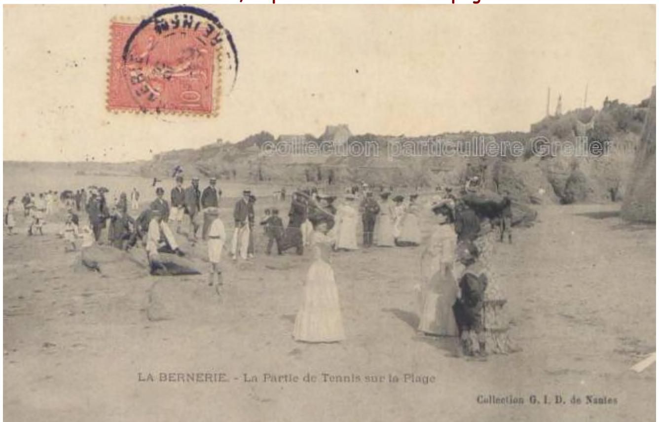
La Bernerie, la partie de tennis sur la plage

cartes postales issues de collections particulières, numérisées par Odile HALBERT avec l'autorisation de ces particuliers. Tous droits de reproductions de ce site réservés ailleurs